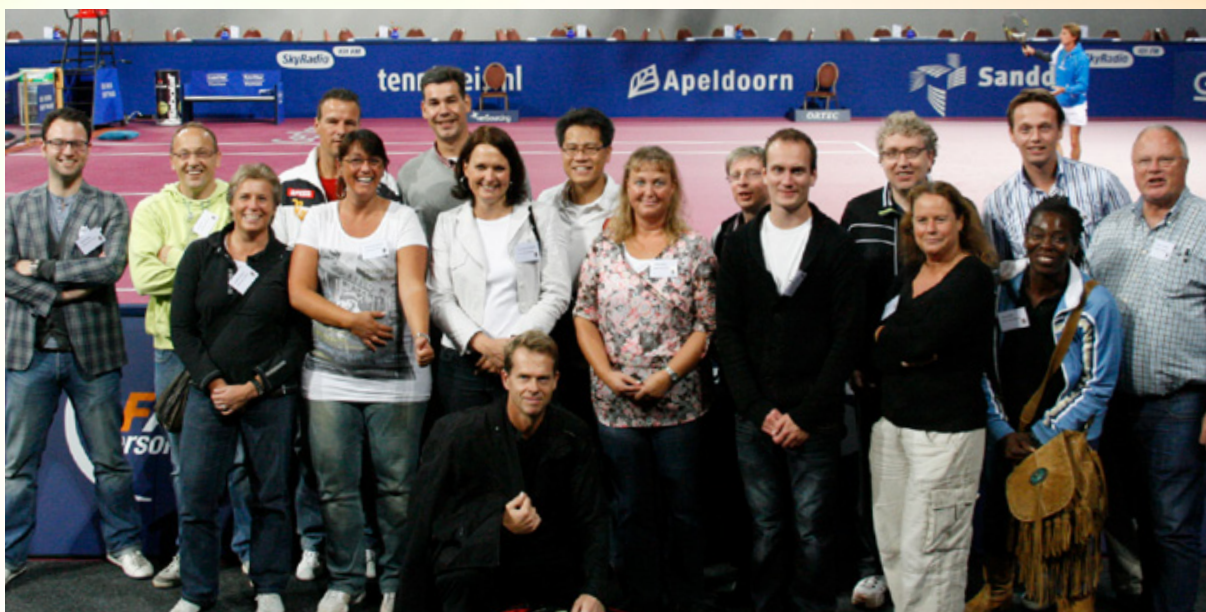
Deelnemers aan de Masterclass Arbitrage met Stefan Edberg

te delen zijn, wat het spelen aantrekkelijker maakt. Omdat de kans op het behalen van een slechte rating afneemt, is duidelijk te zien dat het aantal walk-overs afneemt. Dit heeft weer een positief effect op het Dynamische Speelsterkte Systeem.