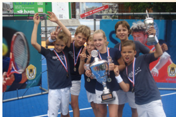
Finalisten Straattennis Cup