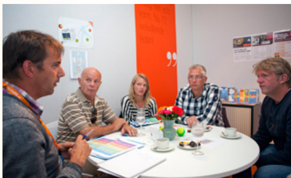
KNLTB coördinator Verenigingen in gesprek met verenigingsvertegenwoordigers.

Clubkoers ondersteunt verenigingen bij het bereiken van hun ambities. Dat kan op twee manieren. Met het aangeboden materiaal kunnen verenigingen zelfstandig aan het werk, maar ook kan begeleiding en ondersteuning van een adviseur worden ingezet. Op de website www.tennis.clubkoers.nl staat nu ook informatie over drie belangrijke zaken die binnen vrijwel iedere vereniging spelen: een plan om digitaal en stap voor stap een verenigingsbeleidsplan