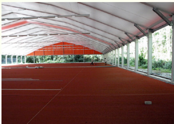
Overkapte gravelbaan van TC Capelle.

De KNLTB is nauw betrokken geweest bij het ontwerp van een actuele ontwikkeling op het gebied van tennisaccommodaties: het overkappen van tennisbanen. De bond heeft (voorlopige) minimale randvoorwaarden opgesteld waaraan een overkapping moet voldoen. Het afgelopen jaar zijn twee tennisparken voorzien van een overkapping.