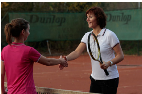
Deelnemers aan de Masterclass Arbitrage met Stefan Edberg

Het aantal categorie 2-toernooien is sterk toegenomen als gevolg van de mogelijkheid om deze doelgroep te bedienen bij de open toernooien.