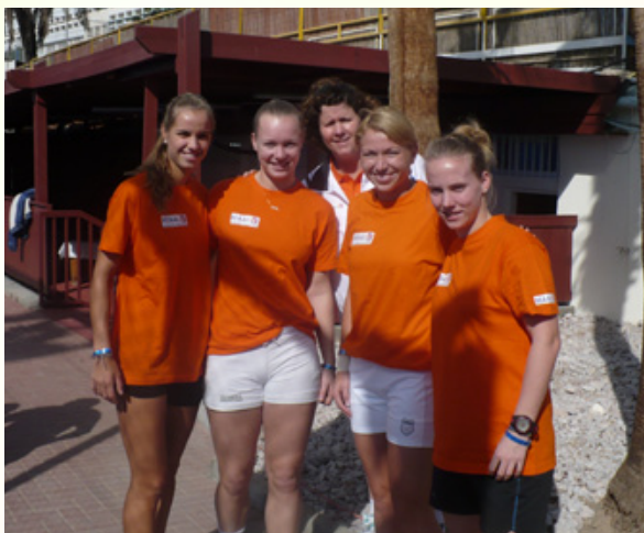
Nederlands Fed Cupteam

vervolgens met 2-1 van Zwitserland te verliezen slaagde de Nederlandse dames er niet in om zich te plaatsen voor de play-offs voor een plaats in de Wereldgroep.