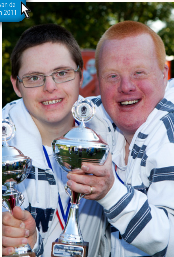
Winnaars Nationale Kampioenschappen G-tennis